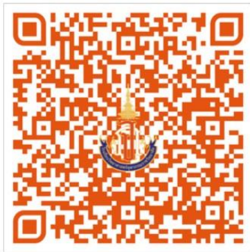
แบบรายงานตัวและยืนยันสิทธิ์ ม.4

แบบรายงานตัวและยืนยันสิทธิ์การเข้าเรียน โรงเรียนวิทยาศาสตร์จุฬาราชวิทยาลัย มุกดาหาร ชั้นมัธยมศึกษาปีที่ 4 ปีการศึกษา 2567