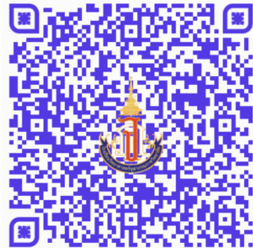
รายงานตัว และยืนยันสิทธิ์ ม. 4

ส่งแบบรายงานตัวและยืนยันสิทธิ์การเข้าเรียน โรงเรียนวิทยาศาสตร์จุฬาราชวิทยาลัย มุกดาหาร ชั้นมัธยมศึกษาปีที่ 4 ปีการศึกษา 2567