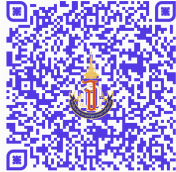
รายงานตัว และยืนยันสิทธิ์ ม. 4

ส่งแบบรายงานตัวและยืนยันสิทธิ์การเข้าเรียน โรงเรียนวิทยาศาสตร์จุฬาราชวิทยาลัย มุกดาหาร ชั้นมัธยมศึกษาปีที่ 4 ปีการศึกษา 2567