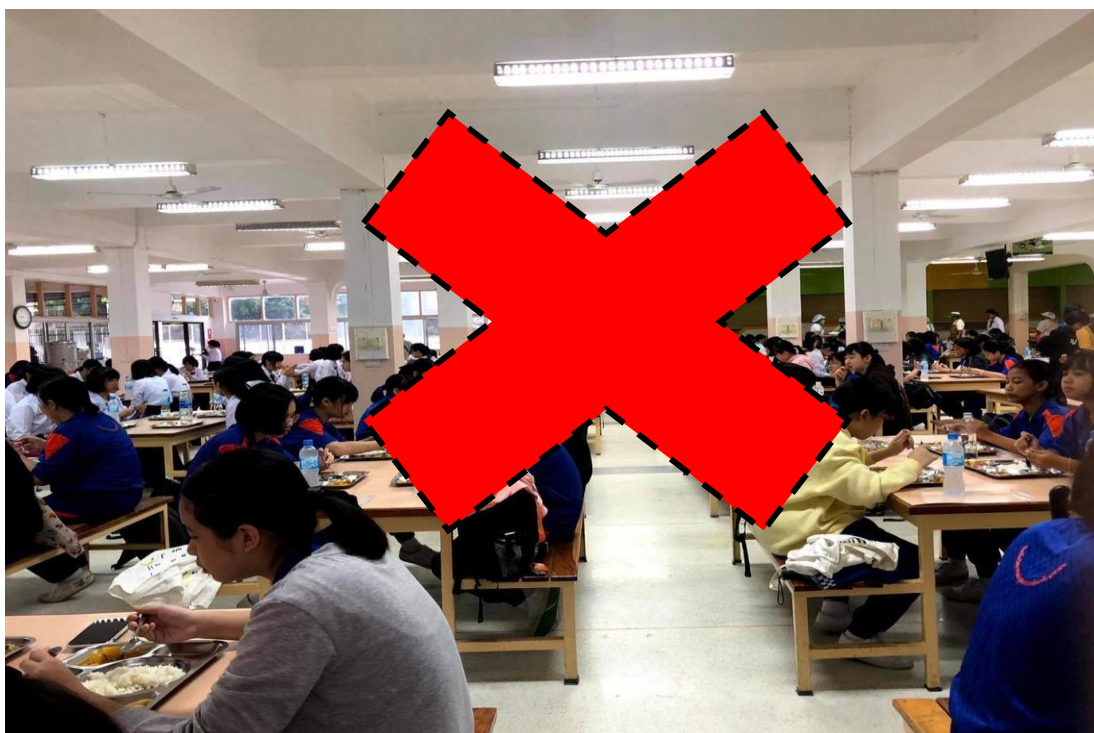
ลดการนั่งเป็นกลุ่ม