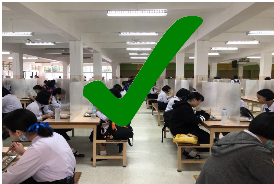
การรับประทานอาหารเช้าของนักเรียนประจำเรือนพักนอน