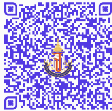
รายงานตัว และยืนยันสิทธิ์ ม. 4

ส่งแบบรายงานตัวและยืนยันสิทธิ์การเข้าเรียน โรงเรียนวิทยาศาสตร์จุฬาราชวิทยาลัย มุกดาหาร ชั้นมัธยมศึกษาปีที่ 4 ปีการศึกษา 2567